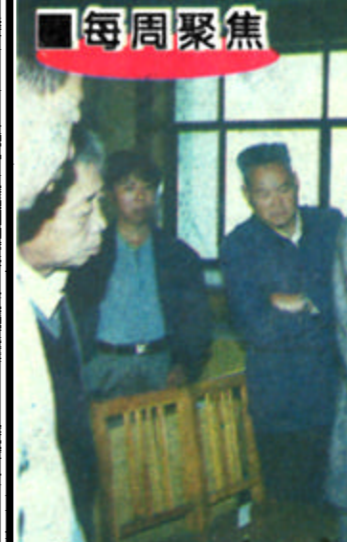
石真农民翰墨情深

黄河入海口的农村亮丽起来了，在新世纪的钟声即将敲响的时候，回顾过去，展望未来，我们更加充满了希望！