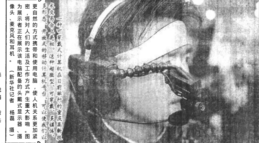
更自然的方式携带和使用电脑，使人机关系更加紧密，将对人们的生活及工作方式产生重大影响。图为展示者正在展示该电脑头戴式显示器。

数百个，总预算将达9.64亿美元。这笔钱到哪里去找呢？当然，最好的办法是寻找自愿捐款，包括现金或实物捐助。此外，可能解决的办法还有，会员国向联合国提供无息贷款、联合国向会员国发放公共债券、商业借贷等等。（《福州晚报》）